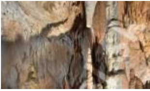
Japońska herbaciarnia z baldachimem