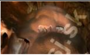
Komora Majka – widok z bliska szaty naciekowej