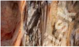
Komora Majka – Rzymskie Łaźnie