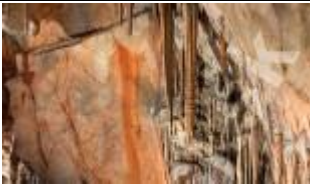
Komora Majka – Rzymskie Łaźnie