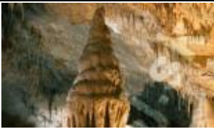
Komora indyjskich pagod