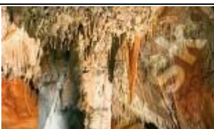
Widok z bliska kalcytowej szaty naciekowej