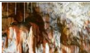
Sala Rozložníka – Chińska pagoda