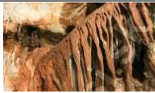
Sala Marmurowa - Meduza