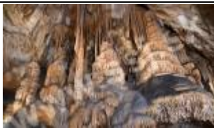
Komora Stara - Baldachim