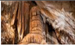
Komora Stara - Baldachim