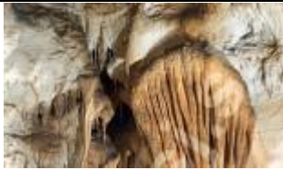
Komora Wielka - Meduza