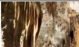
Korytarz do Sali Kowalskiej