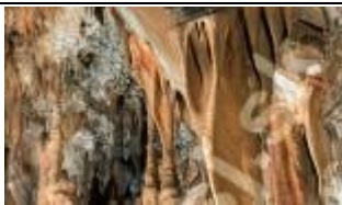
Komora Wielka - Galeria