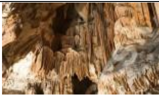
Komora Wielka - Liście tabaki