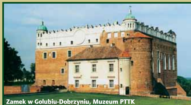
Zamek w Golubiu-Dobrzyń, Muzeum PTTK

Członków PTTK łączy pasja uprawiania turystyki, poznawcza ciekawość i chęć odkrywania piękna swojego kraju, a także potrzeba społecznego działania.