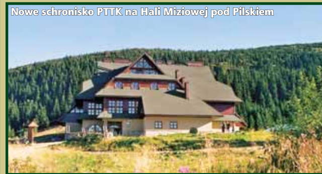
Nowe schronisko PTTK na Hali Miziowej pod Piłskiem

Znaczna liczba schronisk i stanic wodnych jest usytuowana na terenach chronionych, w parkach narodowych i ich otulinach, w parkach krajobrazowych, strefach ciszy, na najatrakcyjniejszych szlakach turystycznych w Polsce.