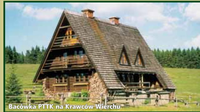
Bacówka PTTK na Krawców Wierchu

Baza Towarzystwa jest dostępna dla wszystkich i obejmuje wiele obiektów turystycznych: hoteli, domów wycieczkowych, schronisk górskich, ośrodków kempingowych, pól namiotowych i innych obiektów hotelarskich, gdzie na turystów czeka tysiące miejsc noclegowych o różnicowanym standardzie oraz liczne miejsca w obiektach gastronomicznych.